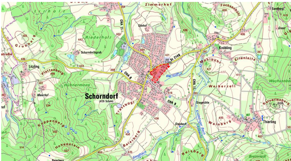
Übersichtslageplan mit Lage der Änderungsflächen (rot), o.M.

Die Änderungsflächen sind leicht von Nordwesten nach Südosten geneigt.