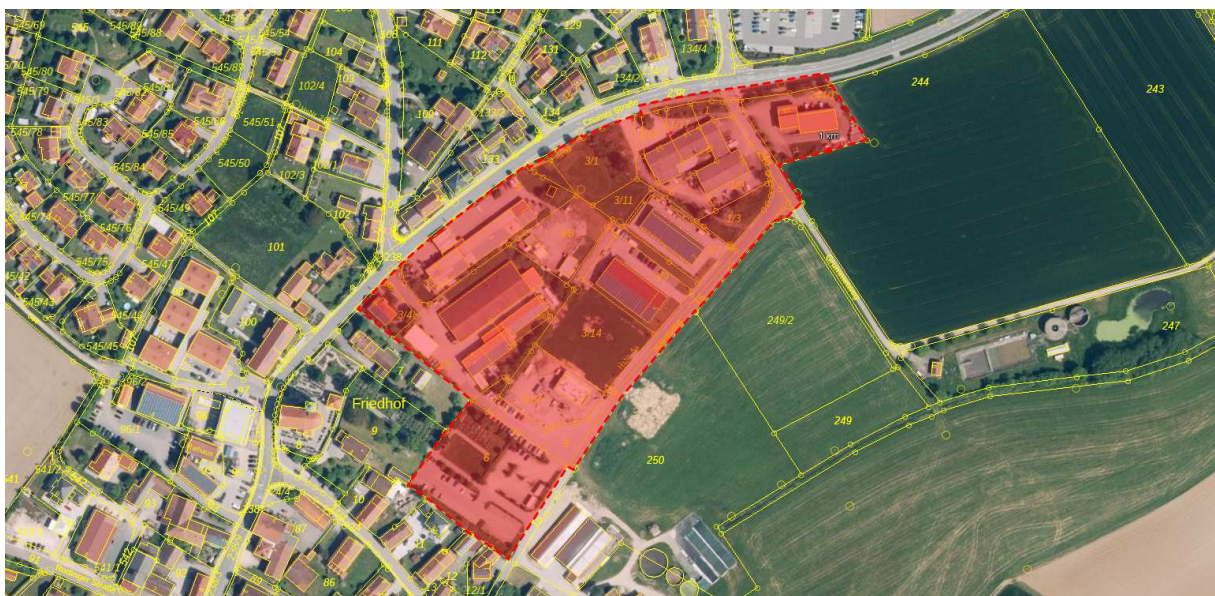
Luftbild mit Lage des Änderungsbereiches (rot), o.M.